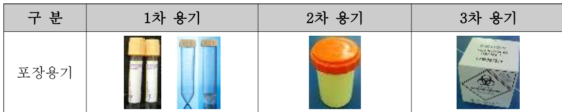
<3중 포장용기 예시>